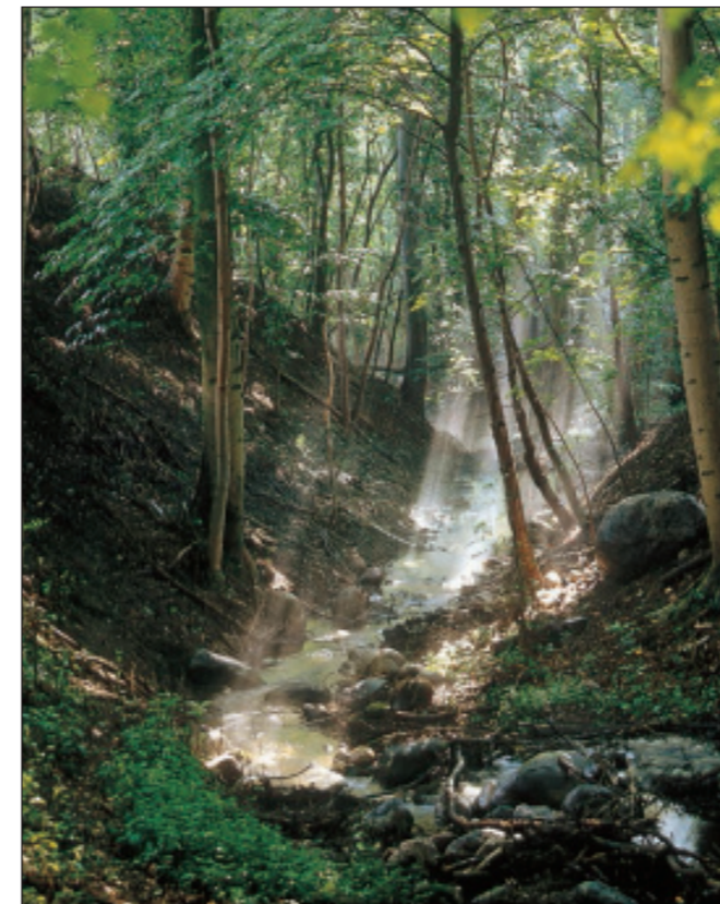
In einer Schlucht bei Klocksinn