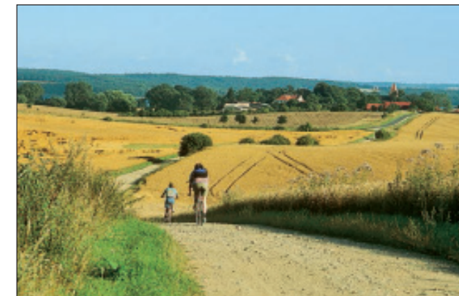
Auf dem Weg nach Bülow

Nachdruck, Vervielfältigung oder elektronische Wiedergabe, auch einzelner Teile, die vom Herausgeber nicht genehmigt wurden, sind untersagt. Alle Rechte vorbehalten! Titelbild: Blick vom Silberberg auf den Teterower See.