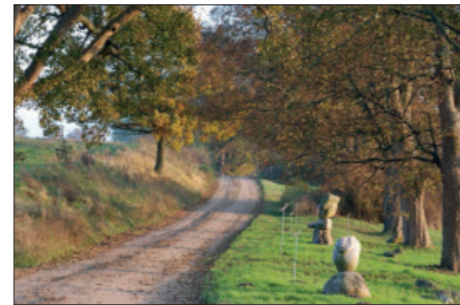
Skulpturenweg bei Görzhausen

Der Malchiner See, zwischen den Höhenzügen eingesenkt, zählt mit neun Kilometern Länge und zwei Kilometern Breite zu den größeren Seen des Landes. Am Ostufer befinden sich zwei kleine Zeltplätze sowie einige Boots- und Ferienhaussiedlungen. In Dahmen gibt es mehrere Übernachtungsmöglichkeiten, darunter eine Jugendherberge.