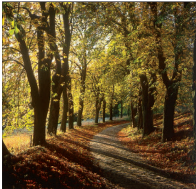
Kastanienallee bei Tessenow

Die Zusammenlegung von landwirtschaftlichen Flächen zu großen Schlägen ist in Nordostdeutschland bereits damals in gewissem Umfang erfolgt. Auch viele Wirtschaftswege und Alleen stammen aus dieser Zeit. Somit sind die Spuren der Gutswirtschaft noch heute erkennbar.