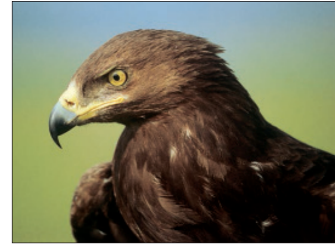
Schreiadler. Im Naturpark brüten jährlich um die 6 Paare, das sind ca. zehn Prozent der Brutvorkommen in Mecklenburg-Vorpommern

Der Kummerower wie auch der Malchiner See mit Umland sind wichtige Rastgebiete nordischer Entenvögel. Jährlich rasten im Herbst und Frühjahr 20.000 bis 30.000 Bläss- und Saatgänse, bis zu 1.700 Haubentaucher und 4.000 Pfeif- und 3.000 Reiherenten, aber auch kleinere Trupps von Krick- und Löffelenten, Gänse- und Zwergsägern. Auf dem Malchiner See und bei Kützerhof haben bis zu 2.000 Kraniche ihre Schlafplätze. Gegenwärtig brüten im Naturpark jährlich ca. 6 Paare des Schreiadlers, etwa 15 des Fischadlers und ca. 10 des Seeadlers. Schreiadler haben besondere Ansprüche und brüten nur in ruhigen, ungestörten Wäldern, benötigen aber in der Nähe zur Nahrungssuche Moore und Grünland.