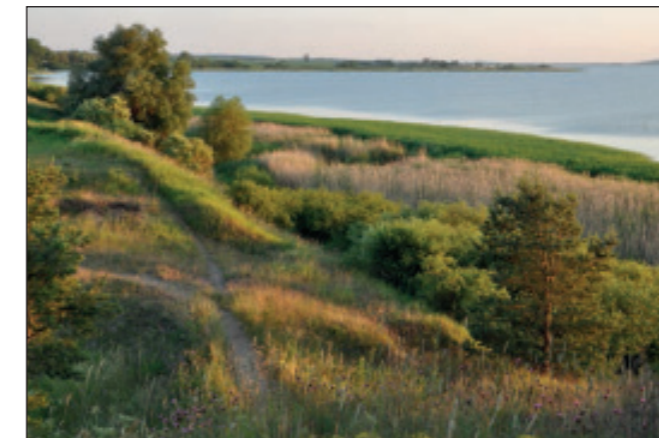
Abendstimmung bei Meesiger

Der Kummerower See ist mit 33 Quadratkilometern der viertgrößte See in Mecklenburg-Vorpommern. Es gibt mehrere Badestellen, Rast- und Zeltplätze. Fahrgastschiffe verkehren von Demmin und von Aalbude aus auf dem See. Sehr reizvoll sind die Wanderwege über die Hügel bei Gorschendorf und Salem. Am östlichen Ufer kann man von Verchen bis Meesiger dicht am See auf unserem Natur-Erlebnispfad durch eine abwechslungsreiche Landschaft wandern. Immer wieder öffnet sich eine neue Sicht über den See. Die Peene verlässt den Kummerower See als langsam fließender Fluss in Richtung Ostsee und gehört bereits zum Naturpark „Flusslandschaft Peenetal“. Eine Bootsfahrt auf der Peene ist ein besonderes Erlebnis, wenn man sich per Paddel-, Ruder- oder Segelboot fortbewegt und so die Natur in Ruhe beobachten kann.