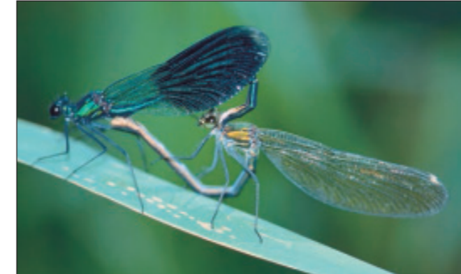
Gebänderte Prachtlibelle, häufig an Bächen

Der Kummerower wie auch der Malchiner See mit Umland sind wichtige Rastgebiete nordischer Entenvögel. Jährlich rasten im Herbst und Frühjahr 20.000 bis 30.000 Bläss- und Saatgänse, bis zu 1.700 Haubentaucher und 4.000 Pfeif- und 3.000 Reiherenten, aber auch kleinere Trupps von Krick- und Löffelenten, Gänse- und Zwergsägern. Auf dem Malchiner See und bei Kützerhof haben bis zu 2.000 Kraniche ihre Schlafplätze. Gegenwärtig brüten im Naturpark jährlich ca. 6 Paare des Schreiadlers, etwa 15 des Fischadlers und ca. 10 des Seeadlers. Schreiadler haben besondere Ansprüche und brüten nur in ruhigen, ungestörten Wäldern, benötigen aber in der Nähe zur Nahrungssuche Moore und Grünland.