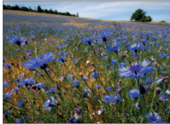
Felder voller Kornblumen sind selten geworden

Am Dahmer Kanal, in den Niederungen bei Malchin und in den Torfstichen existiert eine reiche Sumpfv- und Wasservegetation, darunter Gilbweiderich, Nachtschatten, See- und Teichrosen. Die seltene Krebseschere gedeiht in Torfstichen.