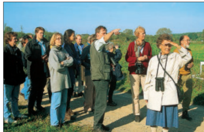
Führung im Naturpark

Der Naturpark bietet regelmäßig Führungen und Veranstaltungen an. Über die Termine informiert die Broschüre „Unterwegs“, die jährlich neu erscheint. Weitere Informationen und Veranstaltungshinweise finden Sie auf der Website http://www.naturpark-mecklenburgische-schweiz.de .