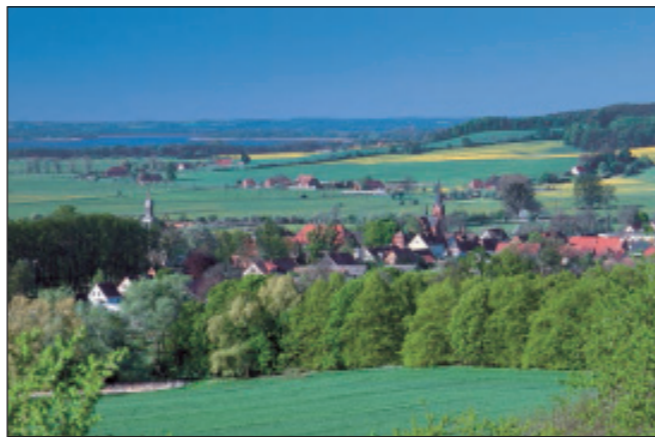
Das Dorf Remplin

Bäume nicht nur Reste einstiger Hutewälder, sondern bedeutende Denkmale einer historischen Landnutzungsform (siehe auch unser Faltblatt „Zeitzeugen am Wegesrand. Die starken Bäume“!). Am Südrand des Malchiner Beckens gibt es Quellen mit beachtlicher Wasserschüttung. Das Quellwasser hat kleine Kerbtäler geformt. Durch das idyllische Burgtal bei Rothenmoor führt ein Wanderweg.