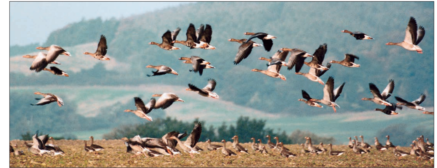
Alljährlich rasten Tausende von nordischen Gänsen auf den Feldern

Über 100 Brutpaare des Kranichs siedeln in Mooren und Bruchwäldern des Naturparks. Der Weißstorch ist noch in ca. 25 Dörfern heimisch. An den Seen und in den Niedermooren bei Neukalen und Malchin ist eine reiche Vogelwelt zu beobachten. Hier treten beispielsweise Schilf- und Drossel-Rohrsänger, Rohrweihe, Bekassine, sowie die osteuropäisch verbreiteten Blaukehlchen, Karmingimpel, Bart- und Beutelmeisen auf. Graugänse brüten in zunehmender Zahl an den Seeufern. Wegen der bedeutenden Vogelwelt sind große Teile des Naturparkes Europäisches Vogelschutzgebiet.