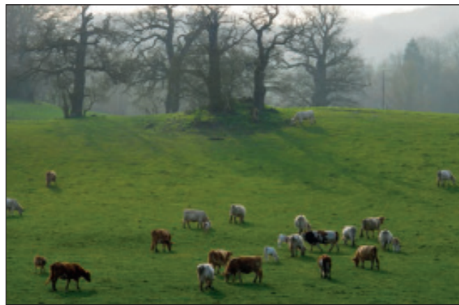
Die Märcheneichen bei Karstorf

Bäume nicht nur Reste einstiger Hutewälder, sondern bedeutende Denkmale einer historischen Landnutzungsform (siehe auch unser Faltblatt „Zeitzeugen am Wegesrand. Die starken Bäume“!). Am Südrand des Malchiner Beckens gibt es Quellen mit beachtlicher Wasserschüttung. Das Quellwasser hat kleine Kerbtäler geformt. Durch das idyllische Burgtal bei Rothenmoor führt ein Wanderweg.