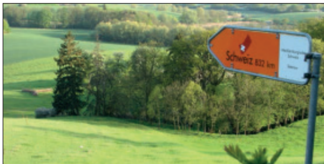
Blick vom Röhelberg bei Burg Schlitz

Den Namen „Mecklenburgische Schweiz“ soll erstmals Erbprinz Georg von Mecklenburg-Strelitz 1811 für die Umgebung von Burg Schlitz verwendet haben. Heute meint man hiermit die stark reliefierte und abwechslungsreiche Landschaft zwischen Teterow, Neukalen, Malchin und Vollrathruhe.