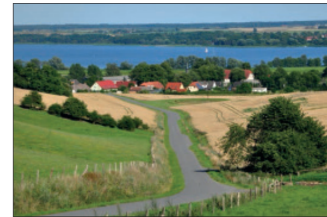
Gorschendorf am Kummerower See

Der Kummerower See ist mit 33 Quadratkilometern der viertgrößte See in Mecklenburg-Vorpommern. Es gibt mehrere Badestellen, Rast- und Zeltplätze. Fahrgastschiffe verkehren von Demmin und von Aalbude aus auf dem See. Sehr reizvoll sind die Wanderwege über die Hügel bei Gorschendorf und Salem. Am östlichen Ufer kann man von Verchen bis Meesiger dicht am See auf unserem Natur-Erlebnispfad durch eine abwechslungsreiche Landschaft wandern. Immer wieder öffnet sich eine neue Sicht über den See. Die Peene verlässt den Kummerower See als langsam fließender Fluss in Richtung Ostsee und gehört bereits zum Naturpark „Flusslandschaft Peenetal“. Eine Bootsfahrt auf der Peene ist ein besonderes Erlebnis, wenn man sich per Paddel-, Ruder- oder Segelboot fortbewegt und so die Natur in Ruhe beobachten kann.