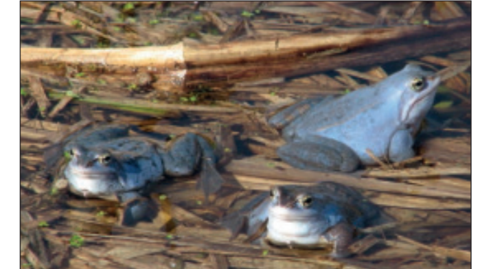
Männliche Moorfrösche sind während der Laichzeit blau gefärbt.

In Söhlen und Mooren rufen Ende März oftmals hunderte Moor- und Grasfrösche. An warmen April- und Maitagen sind stellenweise Laubfrösche und Rotbauchunken in großer Zahl zu hören. Fischotter sind nicht selten, aber wegen ihrer versteckten Lebensweise kaum zu beobachten. Biber haben sich in den letzten Jahrzehnten ausgebreitet. Bei einer Bootsfahrt auf dem Dahmer und Malchiner Kanal oder auf der Peene kann man ihre Burgen, mit etwas Glück auch die Tiere selbst zu Gesicht bekommen.