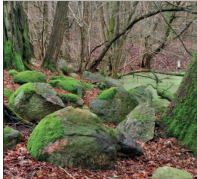
Findlinge bei Vollrathsrufe

Zwischen den Hügelketten liegen weite Becken mit Seen: Teterower See, Malchiner See und Kummerower See. Die Becken wurden als sogenannte Tunneltäler vom Schmelzwasser unter dem Eis ausgespült. Später entstanden in flachen Teilen der Becken Niedermoore.