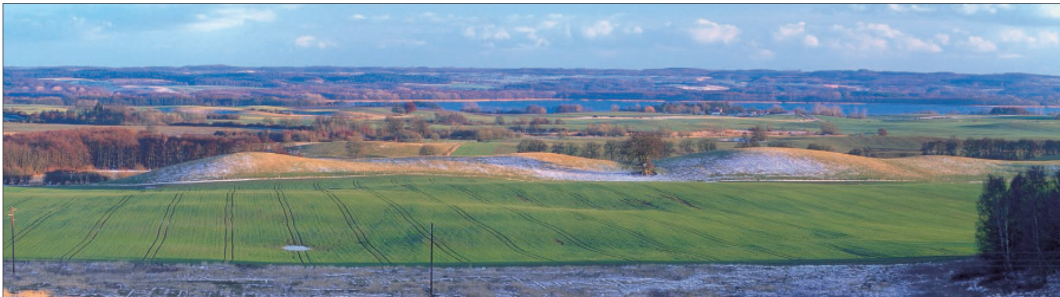
Mecklenburgische Schweiz und Malchiner See

Den wohl schönsten Blick hat man vom Röhelberg bei Burg Schlitz. In sanften Wellen ziehen sich Hügel bis zum Horizont. Grünland, Felder, Feldgehölze, Seen und kleinere Gewässer prägen diese Gegend. Alte, freistehende Eichen sind eine Besonderheit der Mecklenburgischen Schweiz. Mit einem Alter bis ca. 500 Jahren sind diese